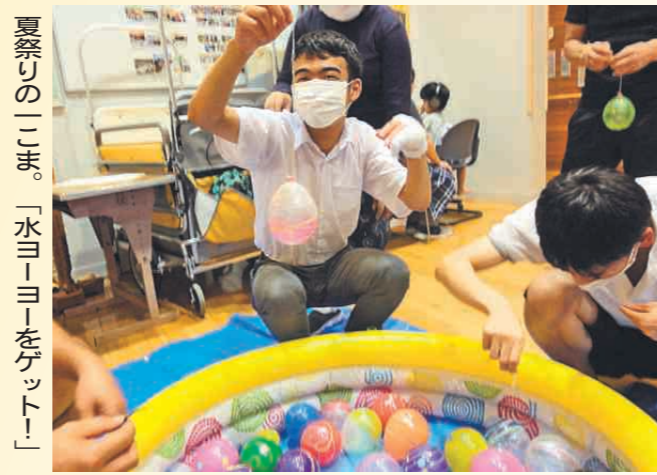
夏祭りの二幕。「水ヨーヨーをゲット！」