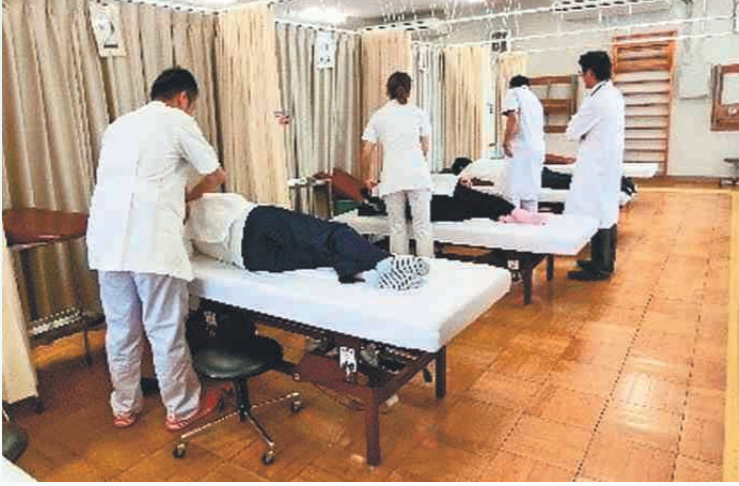
臨床実習であん摩の施術をする生徒たち